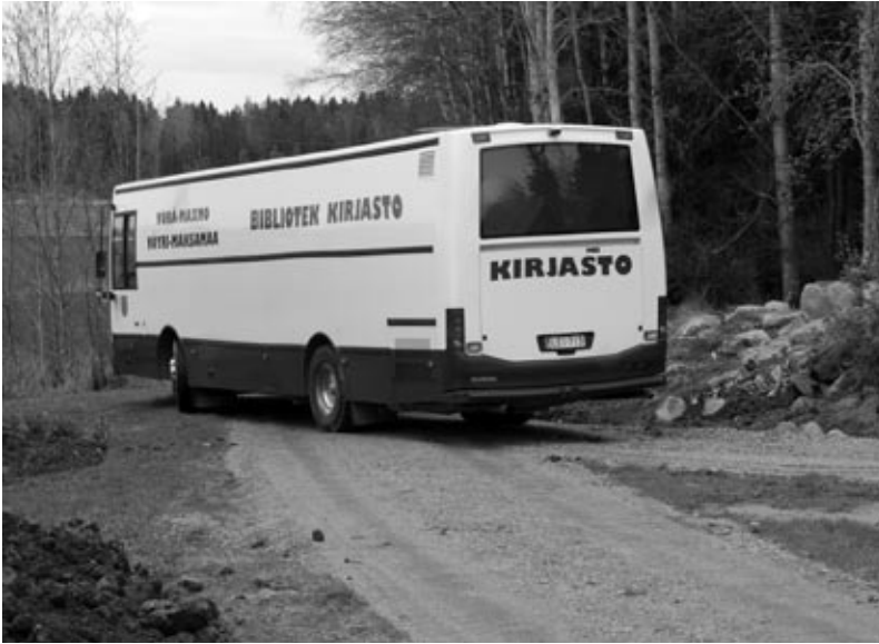
▲ Hemservice. I Vörå-Maxmo besöker biblioteket kunden.

Det blev väldigt intensivt under det första halvåret: ett bibliotek skulle tömmas, böcker och möbler fördelas. Det var tufft också känslomässigt. Allt infomaterial skulle ändras och delas ut, bara det var en hisklig uppgift! Ny tidtabell för bussen skulle göras och testköras. Det gick, förbluffande nog, ganska enkelt i alla fall. Besökarna vande sig snabbt vid de nya förhållandena, som ju egentligen inte påverkade dem särskilt mycket. De behövde inte ens skaffa nya bibliotekskort.