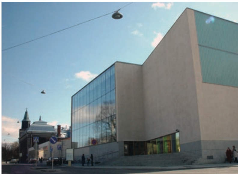
▲ Nya huvudbiblioteket i Åbo öppnade sina dörrar för allmänheten fredagen 2.3.2007. Byggnaden är till ytan 5 400 m 2 . I det nya bibliotekshuset finns nyhetstorg och tidningar, fackavdelning samt barn- och ungdoms-avdelning.