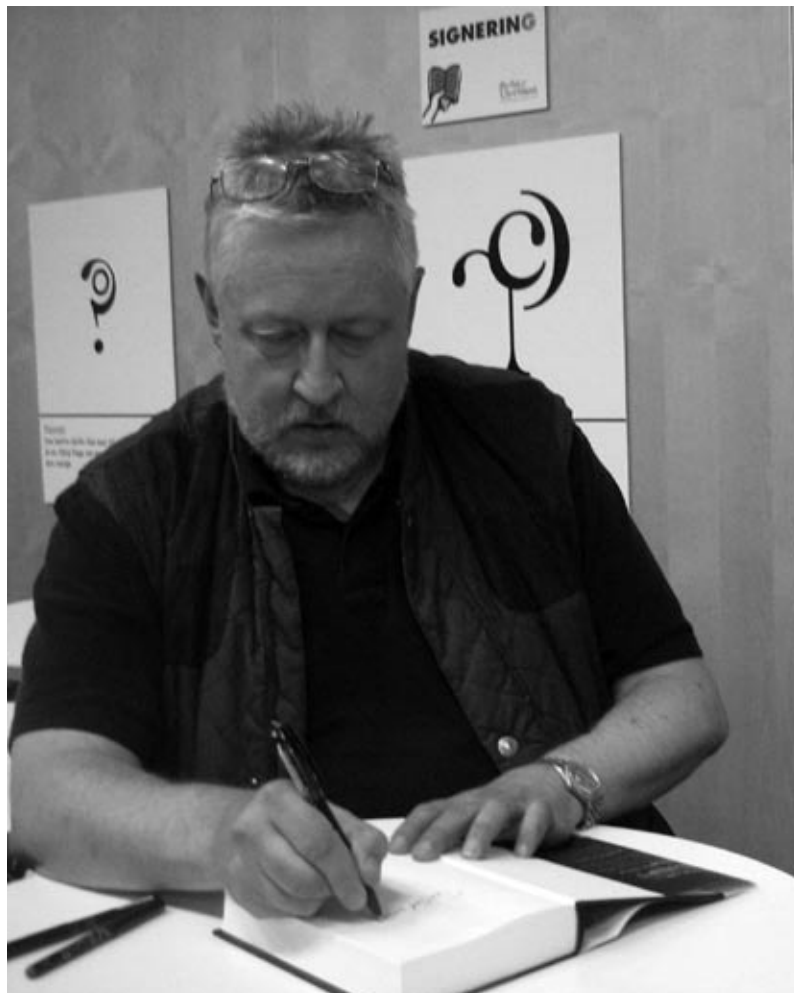
▲ G. W. Persson var en man som bjöd på sig själv och gjorde mer reklam för andra författares böcker än sina egna.