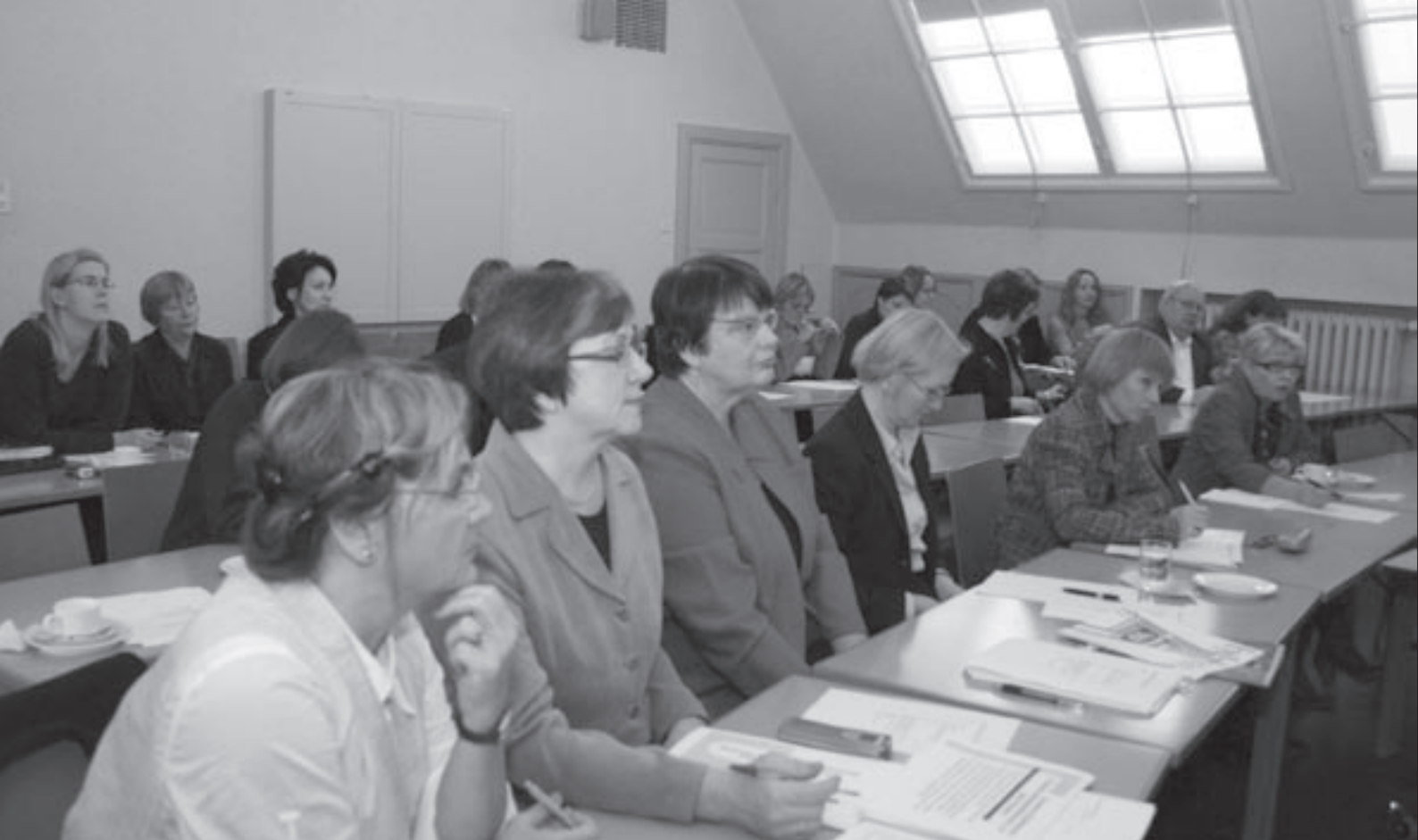
Fundersamma miner på mötet om samgång