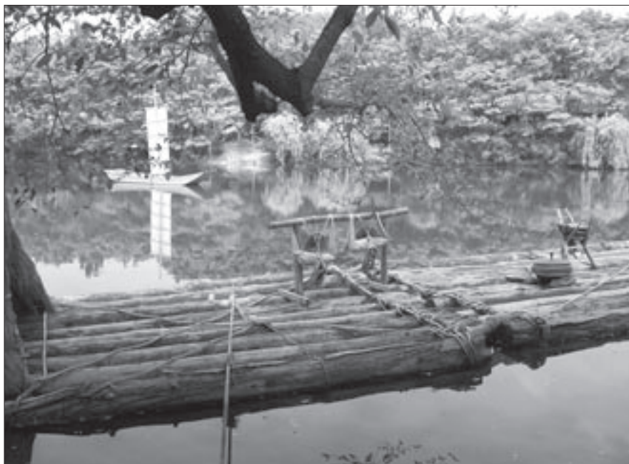
Yongin Korean Folk Village

En teknik att bygga upp intelligenta databaser är att använda automatisk klassifikation, ofta baserad på bibliotekens klassifikations-system, för att omsätta textklassifikation (text classification – TC). Ett projekt kring textklassifikation är t.ex. Desire, ett EU-finansierat portalprojekt för ämnen inom ingenjörsvetenskaper. Söklussen vid Biblioteken.fi är ett exempel på denna tillämpning, med den reservationen att automatiseringen för uppdateringen inte är så långt driven än.