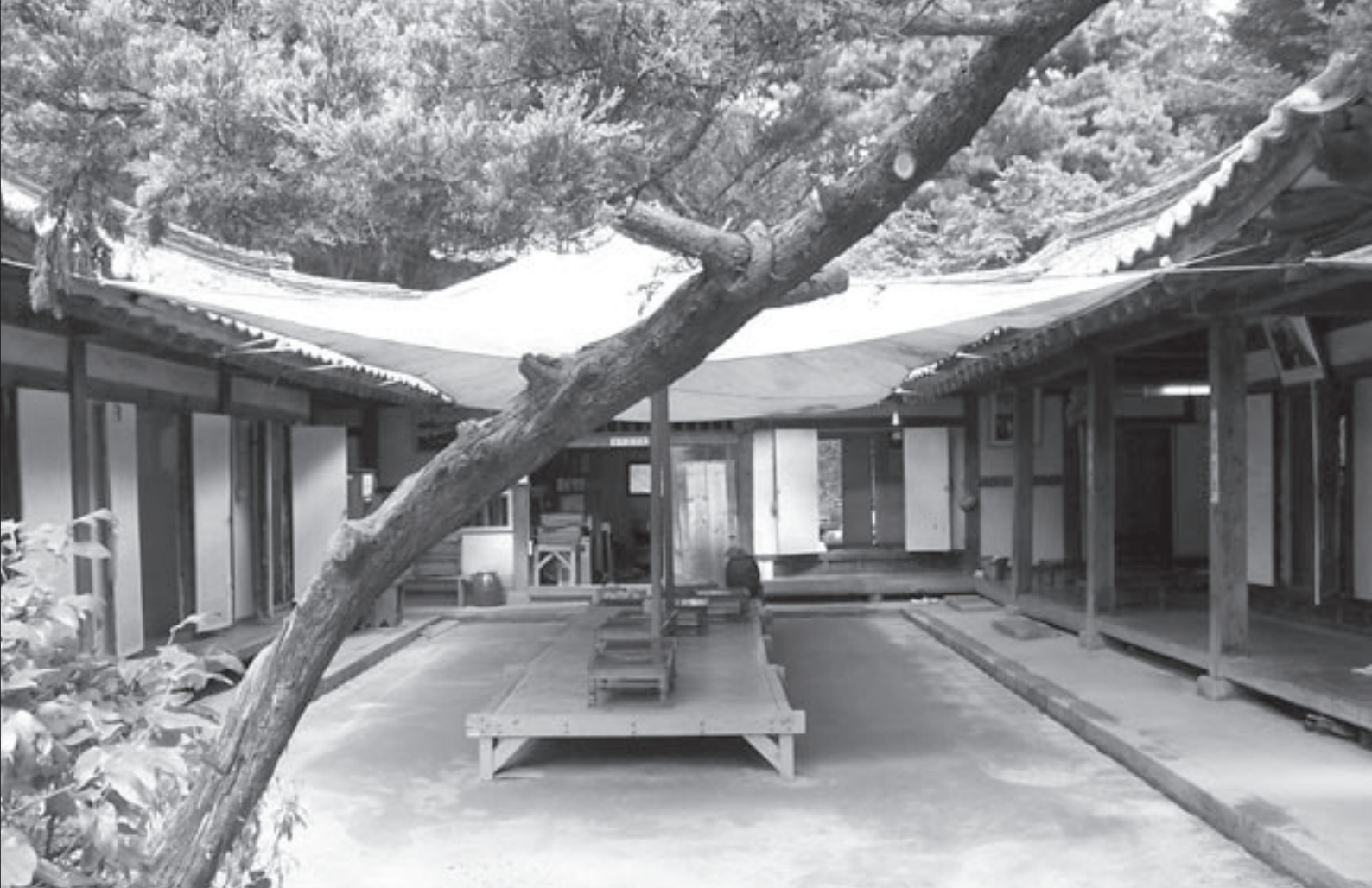
Yongin Korean Folk Village