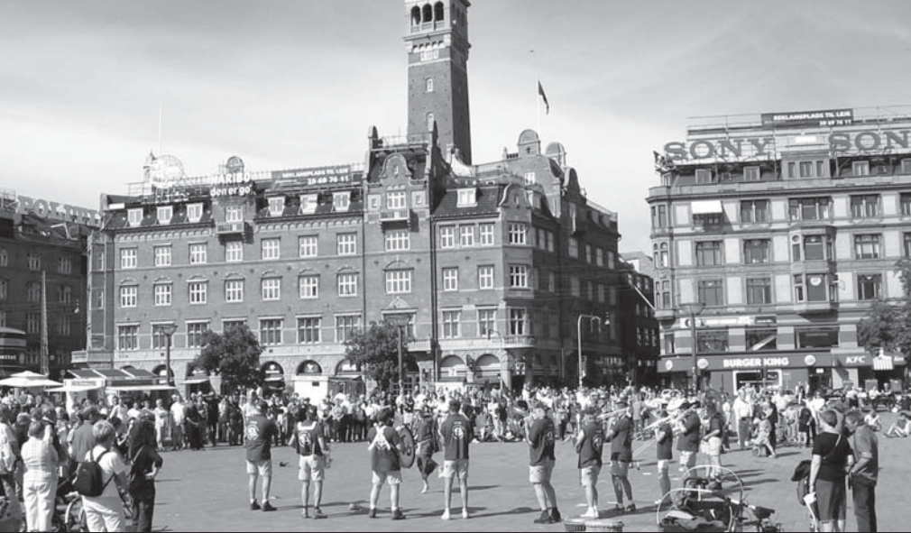
Rådhuspladsen i Köpenhamn