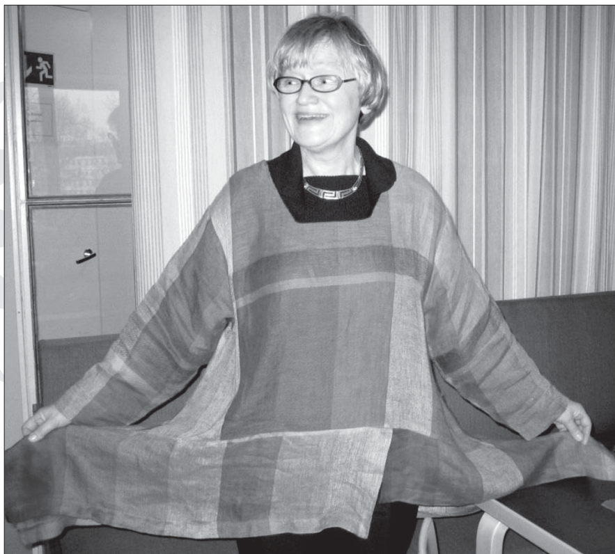
Ringa, 60-åringen, tackar för den stiliga Gullkrona-löparen