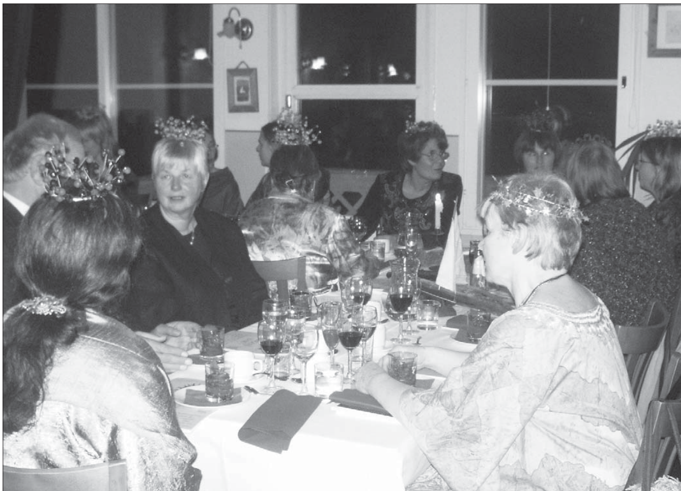
Jubilerande Blanka-drottningar på kvällsfesten.