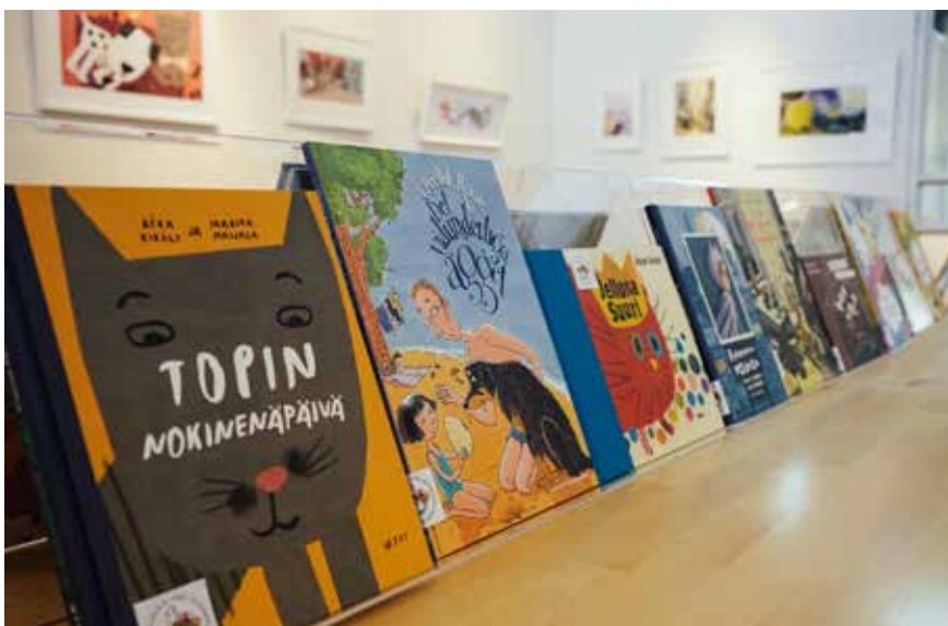
Sagornas trädgård. Så heter utställningen med böcker och illustrationer av 18 nutida barnboksillustratörer. Utställningen turnerar i Finland under jubileumsåret.