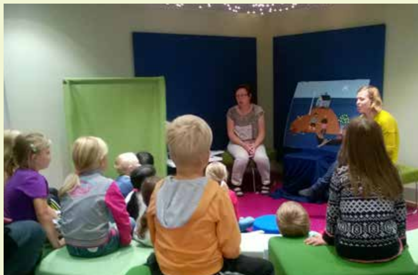
Under Nykarlebyveckan är det tradition att framföra en bearbetad saga av stadens egen sagofarbror Zacharias Topelius.