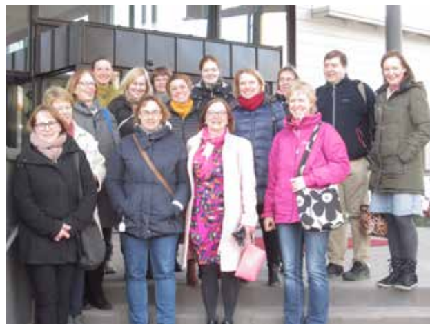
Deltagarna i medlemsresan och våra åländska värdar utanför Kvarter 5.