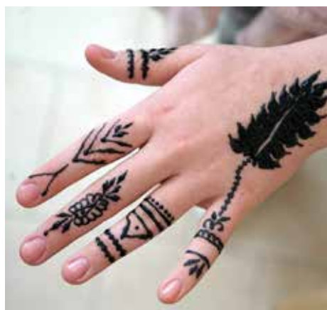
Hennatatueringar från Östafrika.