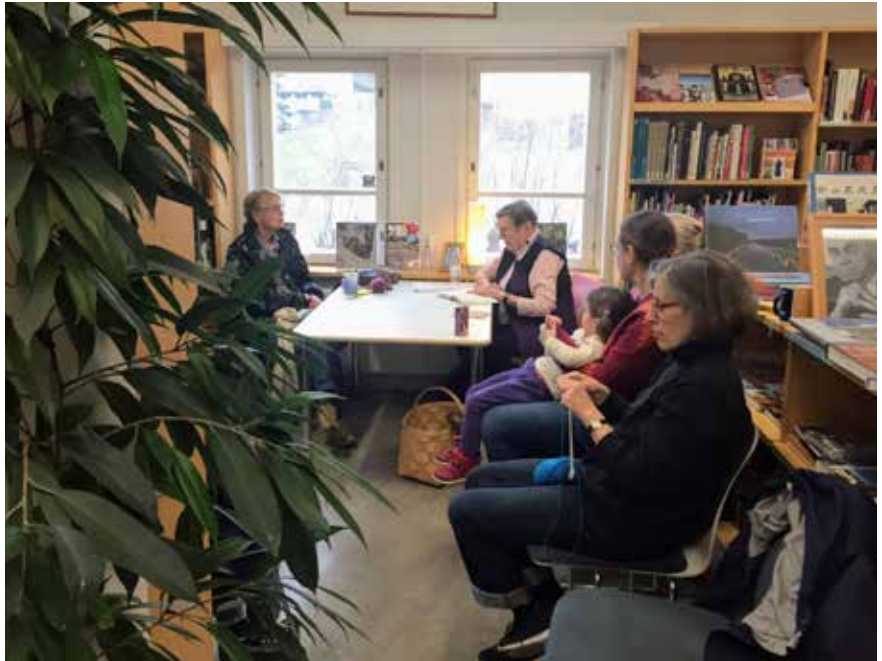
Närvaro och en lugn liten stund bara för sig själv lockar allt fler.

Då jag läser berättelser på novellkafé upplever jag att jag gör något viktigt. Det verkar finnas ett behov av berättelser och högläsning också för vuxna. Särskilt noveller skrivna av Tove Jansson och Alice Munro har fastnat i mitt minne. Alla behöver ett avbrott i ekorrhjulet ibland. En motvikt kanske. Närvaro och en lugn liten stund en vardagskväll bara för sig själv lockar allt fler. Att få fantisera och dagdrömma medan man lyssnar på berättelser lockar. Att funde-