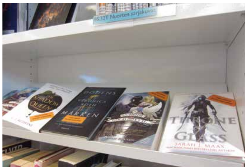
Böckerna märks ut och samlas på en egen hylla på ungdomsavdelningen.

Har du synpunkter på Bibban? Kontakta mig gärna på bibban@fsbf.fi