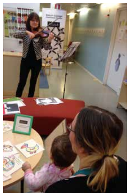
Kulturrådgivning på Södrick rådgivning i Esbo.

Specialbiblioteksfunktionär, Entressebiblioteket, Esbo