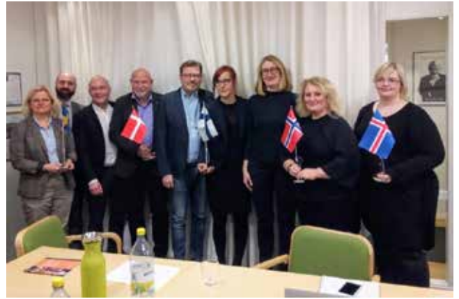
Ordförande och verksamhetsledare från de övriga nordiska biblioteksförningarna.