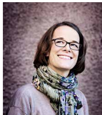
Sjutton texter om läsning är en samling kolumner och blogginlägg skrivna av Katarina von Numers-Ekman under hennes tre år som finlandssvensk läsambassadör.