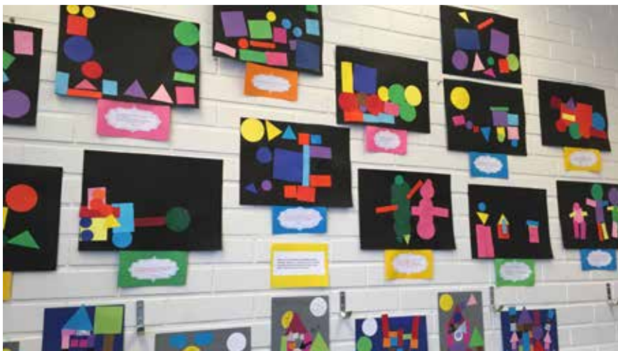
De glada färgerna och barnens beskrivningar av sina konstverk piggar upp i biblioteket.