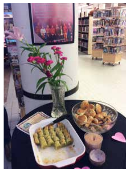
Läckerheter. Under Mellanösterndagen kunde man smaka på kulicha och baklawa.