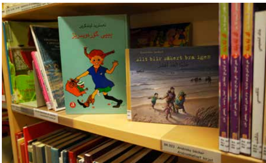
Pippi i Vörå.

Språkhörnan i Nykarleby rymmer böcker för alla åldrar på övriga språk.