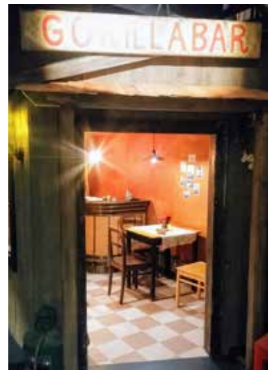
Titta in i hamnkrogen Gorilla Bar.

Sally Jones och Chiefen är trogna vänner.