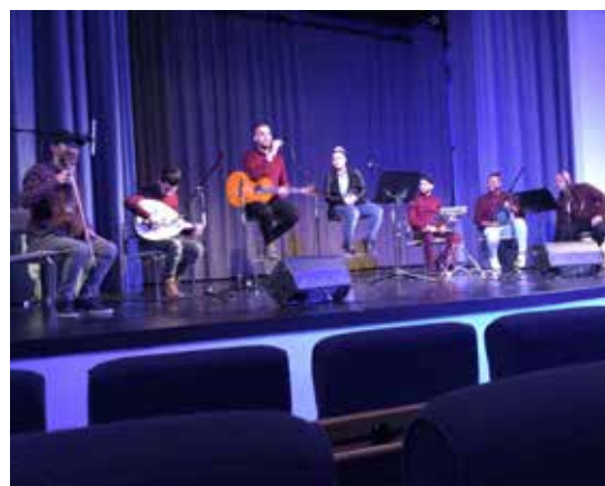
Skickliga! Bäghdad band uppträdde i konsertsalen i Sibbo huvudbibliotek under Mellanösterndagen.