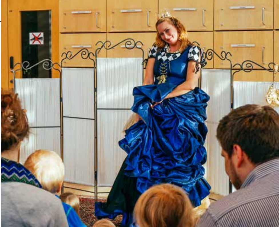
Prinsessan Adalmina. Zacharias Topelius saga "Adalminas pärla" visades i ny tappning på Söderkulla bibliotek i samband med Det stora läsäventyret.

Turnén med bl.a. utställningar besöker under året Sibbo, Vasa, Tammerfors, Helsingfors, Åbo, Björneborg, Kemi och Kuopio.